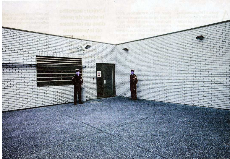
L'entrée du centre de rétention administrative de Coquelles (Pas-de-Calais), en 2009.

Les expulsions d'étrangers restent massives. Un rapport d'ONG dénonce « les atteintes graves aux droits fondamentaux » dans les centres de rétention. Près de 45.000 personnes ont été placées en rétention en 2013 dont 3600 enfants et 1200 seulement assignés à résidence. Durée maximum de rétention : 45 jours. 54% des étrangers de métropole sont éloignés sans avoir croisé un magistrat.